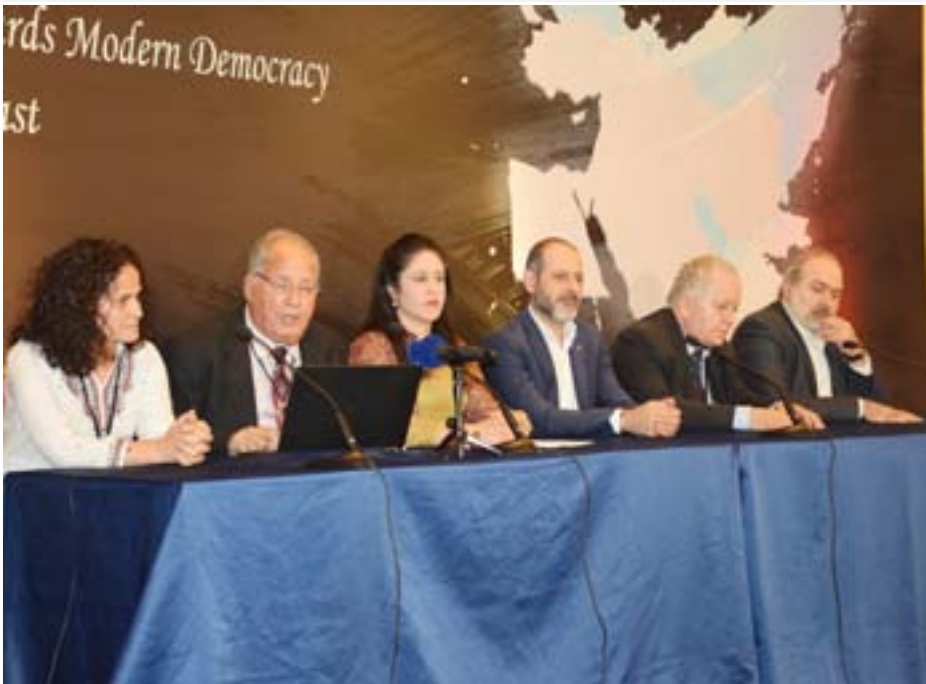
وعاذلة وتقدمية ومندية.

- إن المنطقة بحاجة إلى منظومة فكرية جديدة تتبنى مشروع الأمة الديمقراطية المرتكزة على التعايش المشترك والسلمي بدلاً من التعصب القومي، وإلى احترام العقائد والأديان بدلاً من التعصب الديني، وإلى الفكر المتحرر بدلاً من النظرة الدونية للمرأة.