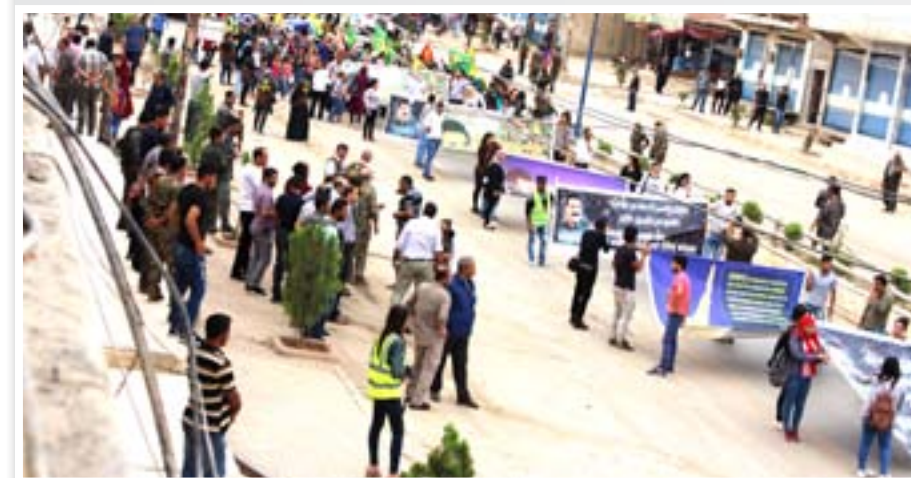
تبرو/غاندي إسكدر. آبدآرآمد

انتصر بنشر فكره وفلسفته وتطلعاته التي تحولت إلى أنشودة للحرية في أفواه جميع شعوب المنطقة، ونوك مرة أخرى على تلاحم الشعوب وإننا سنقتل موأمة الخزي والعار على رمز وحدتنا». وفي الحسكة وتحت شعار «سقط الموأمة الدولية بحق القائد أبو - الحرية للقتل أبو»؛ انطلق المئات من أبناء مقاطعة الحسكة الذين قنموا من مختلف أنحاء المقاطعة، الشنادي، والهول، والعريشة، الحسكة، بمظاهرة حاشدة من دوار الشهيد شاهين يحي تل حجر، وجابت شوارع المدينة حتى ساحة شهداء السريان في حي الكلاسة، وكانت اللافتات واللوحات التي تعبر عن رفض الموأمة الدولية والدعوة إلى إسقاطها ترفرف في سماء المدينة، بينما الهتافات الثورية كانت تملأ بصداها فضواء الحسكة. تندد بالعنوان على الشعب الكردي والمنطقة من خلال شخصية القائد، والدعوة إلى إطلاق سراحه، وكانت الهتافات باللغة العربية والكردية في لوحة تعبر عن وحدة وتكاتف شعوب المنطقة التي جسنتها الأمة الديمقراطية في مقاطعة الحسكة في ظل الإدارة الذاتية الديمقراطية. وبعد الوصول إلى ساحة شهداء السريان، تم الوقوف دقيقة صمت على أرواح