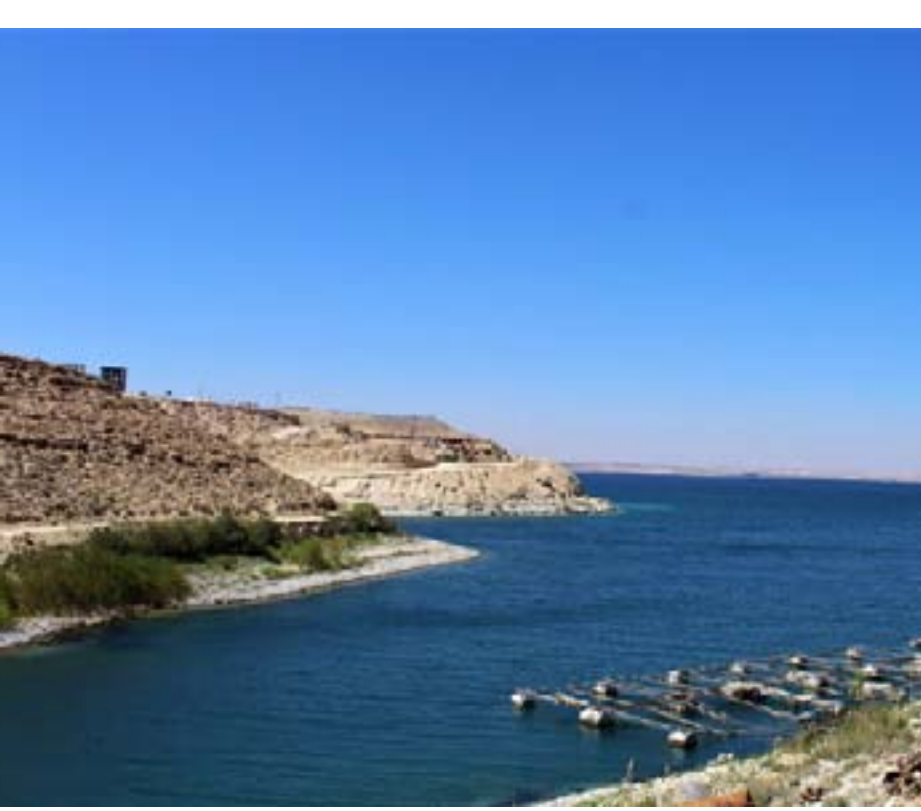
للمحافظة على الثروة السمكية وتشغيل الأيدي العاملة في المنطقة.

تطبيقها في مشروع «مزارع الأسماك» إذ كان من المقرر أن يكون المشروع عبارة عن مجموعة من الأحواض أو