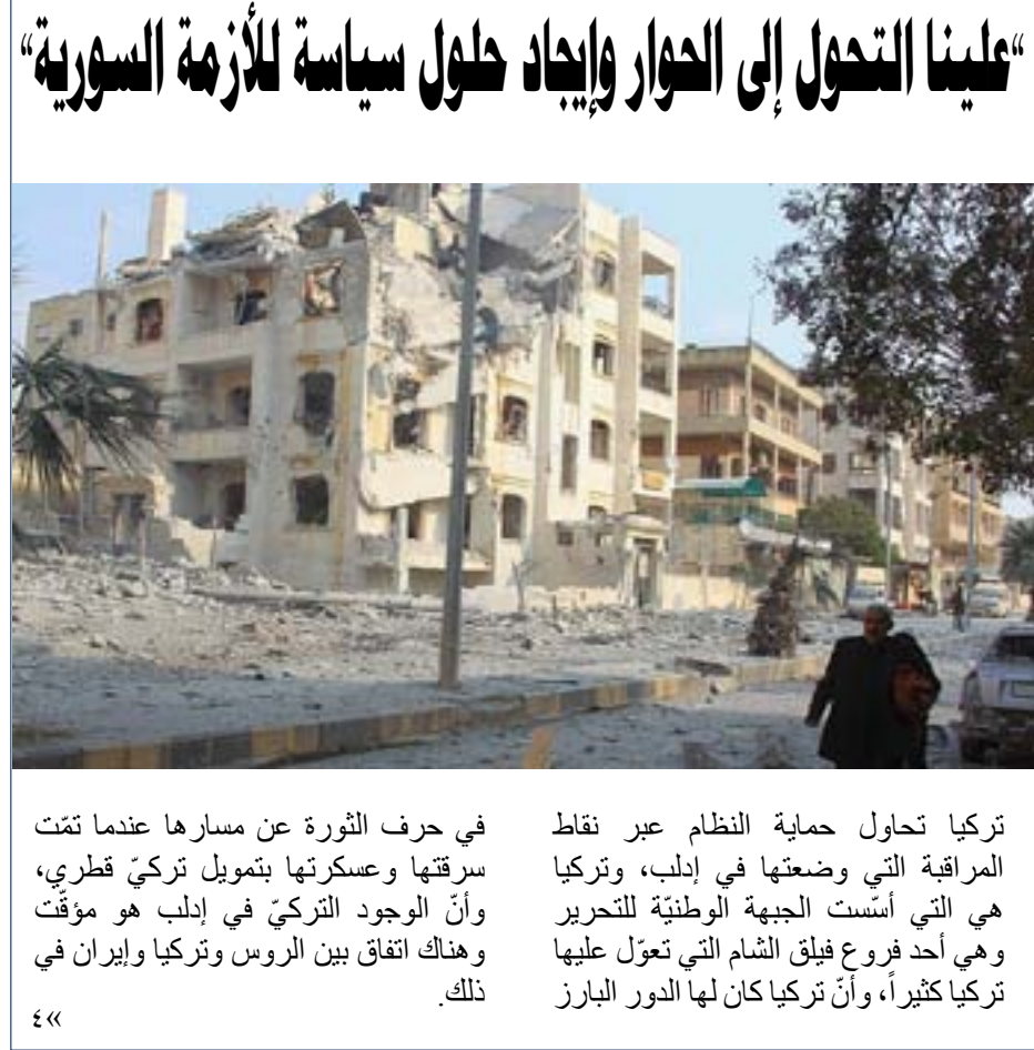
«علينا التحول إلى الحوار وإيجاد حلول سياسية للأزمة السورية»

في حرك الثورة عن مسارها عندما تمت سرققتها وعسكرتها بتمويل تركي قطري، وأن الوجود التركي في إدلب هو مؤقت وهناك اتفاق بين الروس وتركيا وإيران في ذلك.