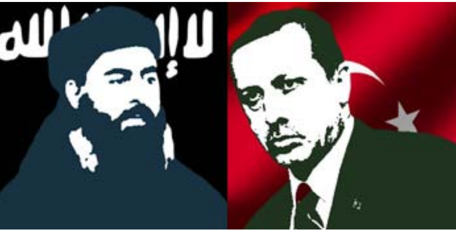
السلم الإقليمي والدوليّ.

تغيّرت الكثير من الروى والمفاهيم في العالم وبخاصة في الشرق الأوسط بعد عام ٢٠٠٠م، وبالتحديد بعد ٢٠ آذار ٢٠٠٣م. مع بدء الحرب الأمريكية على العراق؛ حيث كان الهدف الصريح منها ضرب نظام صدام بعد أن اتخذت دول التحالف آنذاك قراراً بالحرب على العراق بتهمة امتلاك صدام حسين لأسلحة نووية كما ادّعت وقولها: إنَّ ذلك يهدد