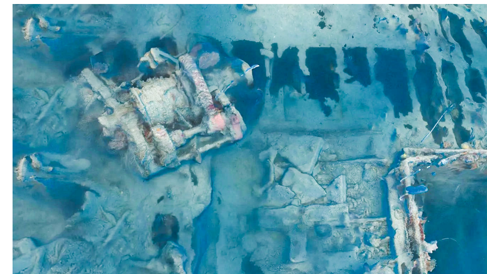
Li heykelê Hofuku Maru ket.

Di 21'ê Îlona sala 1944'an de, Hofuku Maru wekî duyemîn keştiya karwaneke Japonî li peravên rojavayê Lozonê diçû. Di keştiyê de 1 hezar û 289 dîlên şer ên Brîtanî û Holandî hebûn, gelek ji wan ji ber ku neçar bûn li ser tiştê ku wekî “Rêhesina Mirinê” di navbera Burma û Taylandê de bixebitin, westiyabûn. Şert û merc pir dijwar bûn; ronahî tunebû, hewakirin nebaş bû û paqijî tunebû di heman demê de xwarin û av bi zorê ji bo debara jiyane tîrî wan dikir. Li ser keştiyê tu nişanek tunebû ku nişan bide ew girtiyan vediguhezîne. Dema ku balafirên Koma 38'emîn a êrişê ya Hêzên Deryayî yê Dewletên Yekbûyî yê Amerîkayê êrişî karwanê kirin, wan torpîlo avêtin cihê ku xuya bû hedefeke leşkerî ya rewya ye. Yek ji torpîloyan