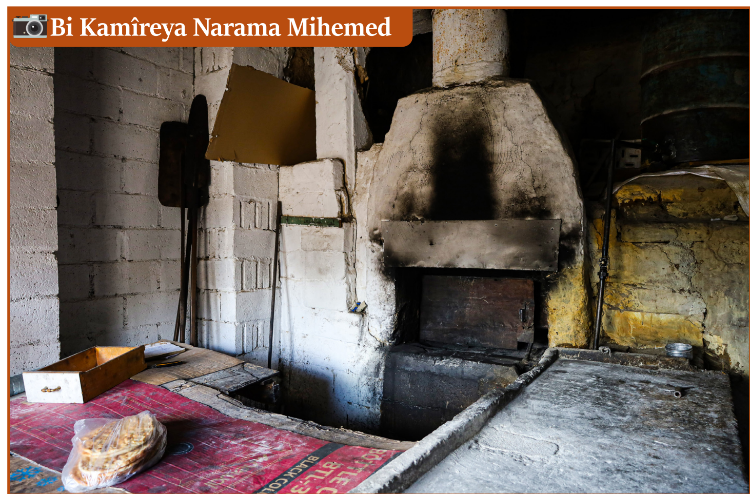
Bi Kamîreya Narama Mihemed

Rola çapemeniyê di balkişandina pirsgrêkên civakî de Rênas Efrîn R-7