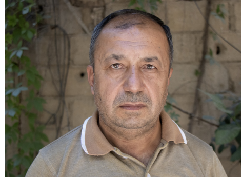
Efrîn, 29'ê Çileyay 2026'an

yan nahêlin û li pêşîya wan dibin asteng anjî dibêjin bila xwediyê wê bi xwe werin anjî em nadin. Piraniya xwe li navçeya Reco li Gundê Çeqmaqa, Elendara û yên derdora wan ev tevger ji hêla hin komên çekdar ve derdikevin. Ev jî zehmetî û astengiyan mezin li pêşîya gelê Efrînê derdixin. Pîranî malbat dengê xwe ji me re dişînin û gazînin ji bo vê yekê dikin. Di heman demê de hin ji gelê Efrîn ku vegerî ne ji ber nedana malên wan mal bi kirê birine û sed dolarî didin. Herweha li beramberî wê jî derfetên kar gelek kêmin, ji bo çareserkirina pîrsgirêkên ku li pêşîya gelê efrînê piştî vegerê derdikeve çareserkirina wan pîrsgirêkan berpîrsariya herdu aliyên ku peyman 29'ê Çileyê îmze kirine ye, ev yek jî dihêle ku gel mecbûr binînin, careke din ji bajarê xwe derkevin. Dema ku em wan agahiyan dibhîzin anjî dişopînin pîranî em di milê raghadinê derxînin pêş û xebat dikin, herwiha em wan agahiyan belge dikin, têkîlî bi kesên têkildar re dikin û wan agahdar dikin da ku çareser bikin.”