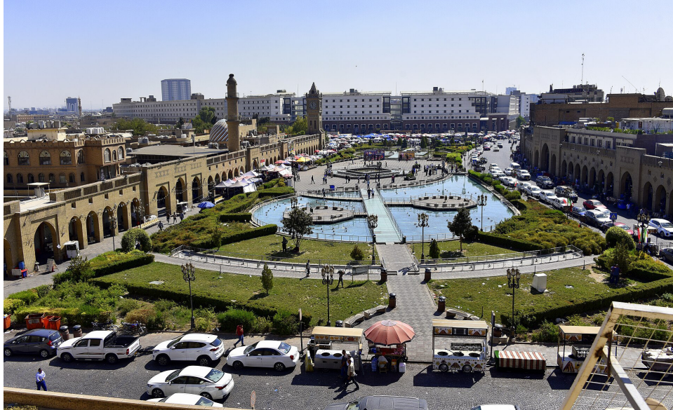
Şoreşa Îlonê û Peymana 11'ê Adara 1970'an

Berî ku di sala 1921'an de li Iraqê monarşî were damezrandin, gelê Kurdistanê hewlên xwe ji bo bîdestxistina serxwebûnê ji Mandata Brîtanî zêde kirin. Serhildana Şêx Mehmed Berzenci ya sala 1919'an yek ji hewldanên cidî yê gelê Kurd bû ji bo avakirina hebûneke serbixwe li Kurdistanê. Serhildanên Barzan ku di destpêka salên 1930'an de dest pê kirin û heta nivê salên 1940'an berdewam kirin, têkoşîna gelê Kurd jî bo mafên xwe yê neteweyî hîn bêtir geş kirin. Di van salan de pevçûnên berdewam di navbera rejîma serdest û şoreşgerên Kurd de çêbûn.