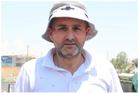
Hemû karmend di xizmeta zifitkirina bajar de ne