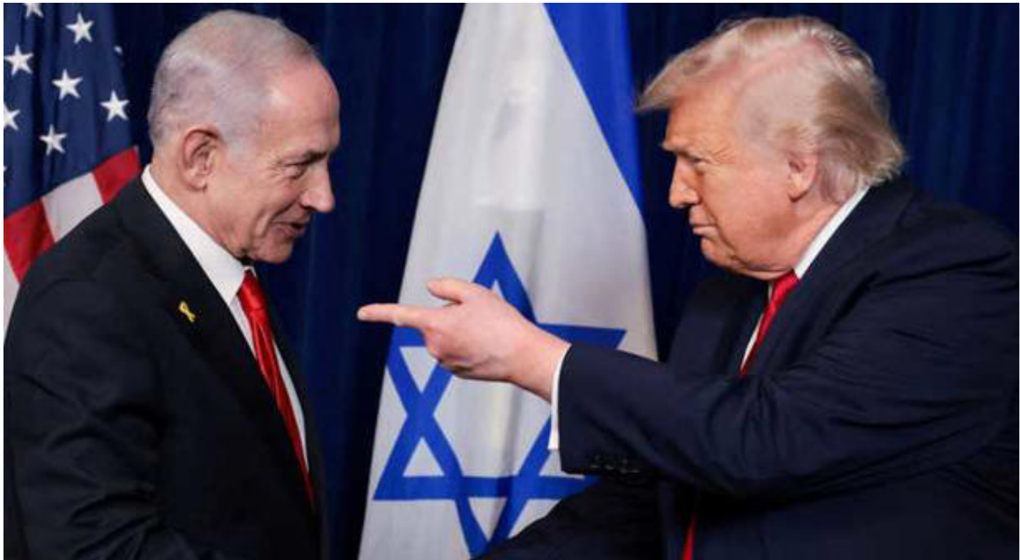
Bertekên hêrs ên Îsraîlê