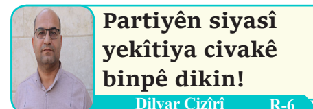
Partiyên siyasî yekîtiya civakê bînpê dikin! Dilvar Cizîrî R-6