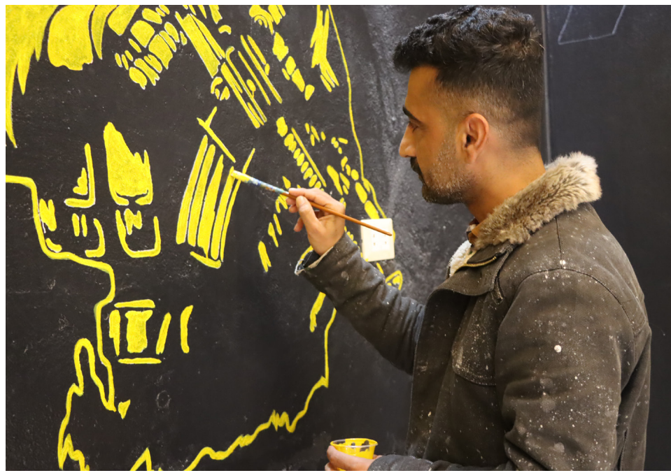
sinorên kevneşopî derbas bibe."