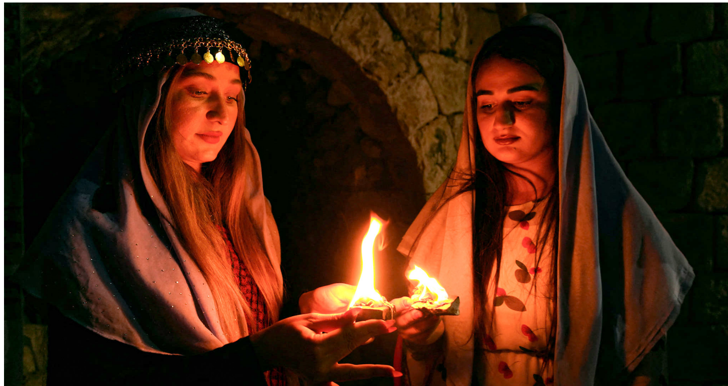
Çar cejn di yekê de

Êzîdî dibêjin ku jê re Çarşema Sor tê gotin ji ber ku di vê rojê de