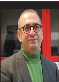
Adife Sakik û 8'ê Adarê

Do dawiyê de dixwazim viya bijim; Ev koalîsyona partiyên Kurdan yên ku hatiye avakirin, ev ne ji bo demê kin anku ji bo bersivdana bûyereki hatiye avakirin. Ev daxwaza gel û partiyên me bû ku bi sala ye xebat ji bo wê hatiye kirin. Ev ê heyanî ku serkeftin misoger dibe û komareke demokratîk tê avakirin wê berdewam bike. Piştî wê ev koalîsyon bibe rêveberiya civakê ya siyasî. Me ev koalîsyon ku em bibin perçeyek ji vî şerî ava nekiriyê, gelê Kurd vî şerî şerê xwe nabîne û derveyî vî şerî disekirin. Ev şer ne şerê gelê Îranê ye jî, ew di navbera du hêzên navnetewî de ye ku dixwazin bibin hegemon. Ji ber wê em berjewendiyên xwe û yên gelê Îranê di vî şerî de nabînin, lê belê bi xwe re metirsîyê tine û di heman demê de dibe ku bi demê re derfetan jî ava bike. Hêza me wek Koalîsyona Partiyên Kurdî û PJAK em dixwazin gelê xwe ji metirsî û xeteriya vî şerî dur bixînin û ger derfet hebe, em bikaribin civaka Îranê demokratîk bikin û hikûmeteke nenavendî bî avakirin ku Kurd bikaribin rêveberiya xwe bidest bixin. Em hewil didin di çarçoveyê demokratîk, nenavendî û Kurdîstaneke xweser de xebatê xwe bidin meşandin. Ev dikare bi awayekî konfederal û nenavendî bi pêş bikeve û lihev bike. Xebatê partiyên me yên Kurdan berê jî hebû û wê heyanî serkeftinê jî berdewam bikin.