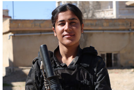
Roj Serê Kaniyê

ye, ji ber wê yekê xwedî derketina li vê rojê divê bi hewbet û wetedar be. Bi rastî tişta ku wan jinan kiriyê bi serîrakerina li hember dîktatoriya zîlam û ya pergalê, di wê demê de têkoşîneke pîroz e. Em ew têkoşîna zêdetirî sed jîni ji xwe re bîngêha têkoşîna xwe ya leşkerî dibînin. Ji ber ku serîrakerina li hember iqtidarê, maf xwestina bo jinan di civakê de, ji têkoşîna me ya roja îro ne qut e. Ya ku di wê demê de di hate kirin bi destê zihniyeta mêr dewletê bû, ji bo guhertina vê yekê ku yek ji mîmarên têkoşîna me ya bêrdozî ye, divê serîrakerina jin hebe, ev yek jî wan jinan beriya sed salan kir."