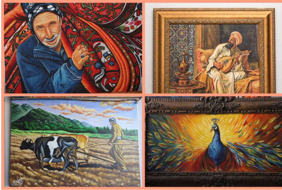
paşeroj û niha de

Di tabloyên wî Wênesazî de, mîrat ne statîf xuya dike, lê belê zindî û nûkirî ye. Ew ne tenê dîmena folklorîk jî nû ve çêdike, lê wê bi awayekî ku bi ruhê serdemê re tîkildar be jî nû ve şîrove dike. Hêza projeya wî ya hunerî li vir e, ew folklorê vediguherîne zimanekî dîtbarî yê hemdem ku dikare bi