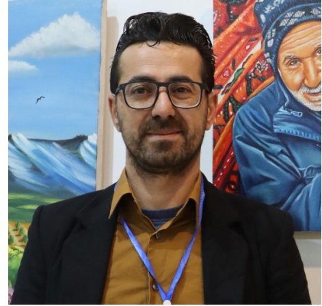
mirovî yê cihanî dide wê bû.