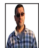
Serkeftin Balansa Azwerî û Pratikê Ye Idrîs Henan R-4