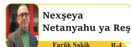
Nexşeya Netanyahu ya Reş Farûk Sakik R-4

Dayikên bajarê Heseke diyar kirin ku bawerîya wan bi hêz û gelê wan heye, li hemberî êrîşên qirkirinê yên dagirkeriya Tirk û çeteyên HTŞ'ê wê serî netewînan û wiha gotin, "Ji bo jiyanê azad pêwîst e berxwedanê were kirin." R-3