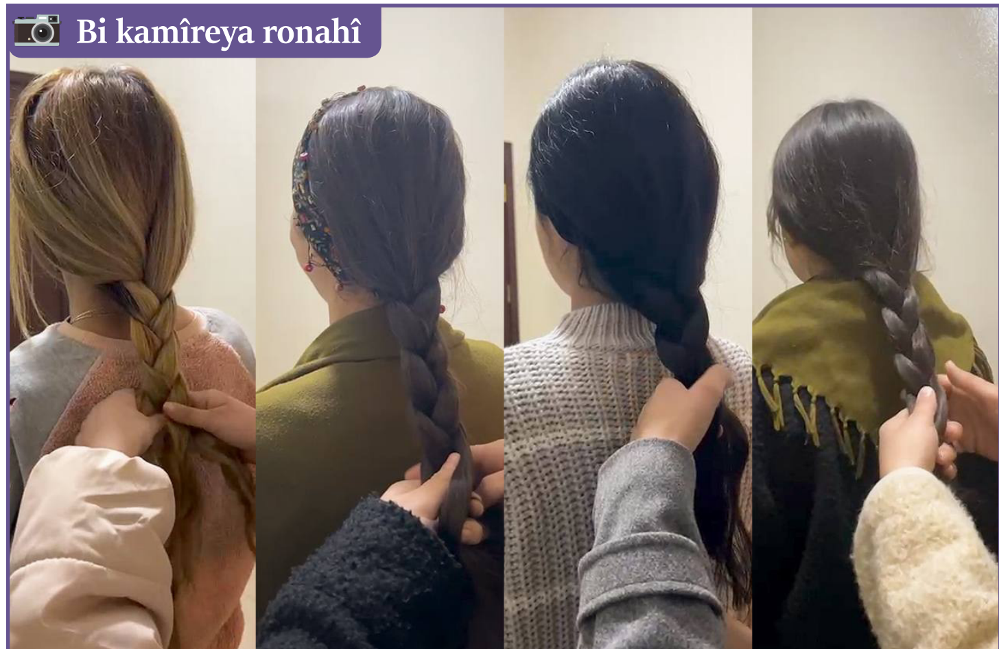
Bi kamîreya ronahî

Ji Pirtûka Ferhenga Biwêjan Ya Diyar Bohtî