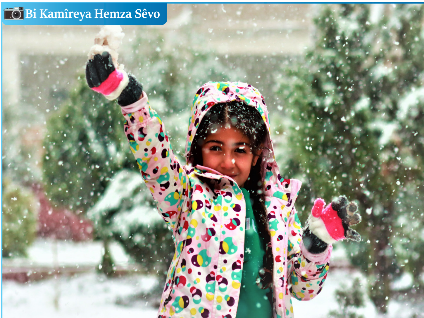
Bi Kamîreya Hemza Sêvo