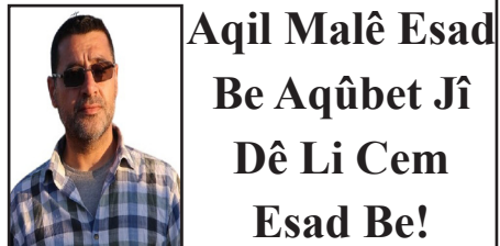
Aqil Malê Esad Be Aqûbet Ji Dê Li Cem Esad Be!