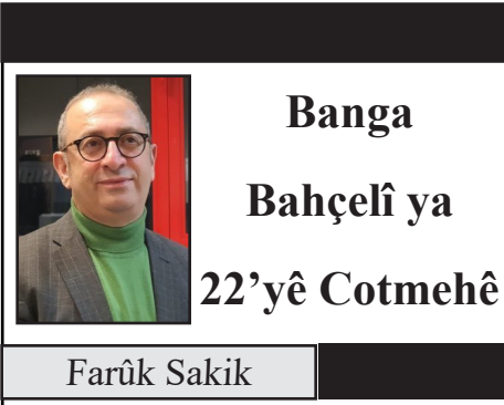
Banga Bahçelî ya 22'yê Cotmehê