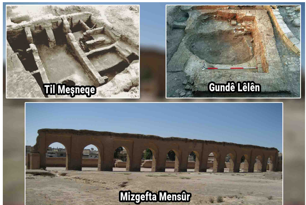
Til Meşneqe Gundê Lêlên Mizgefta Mensûr