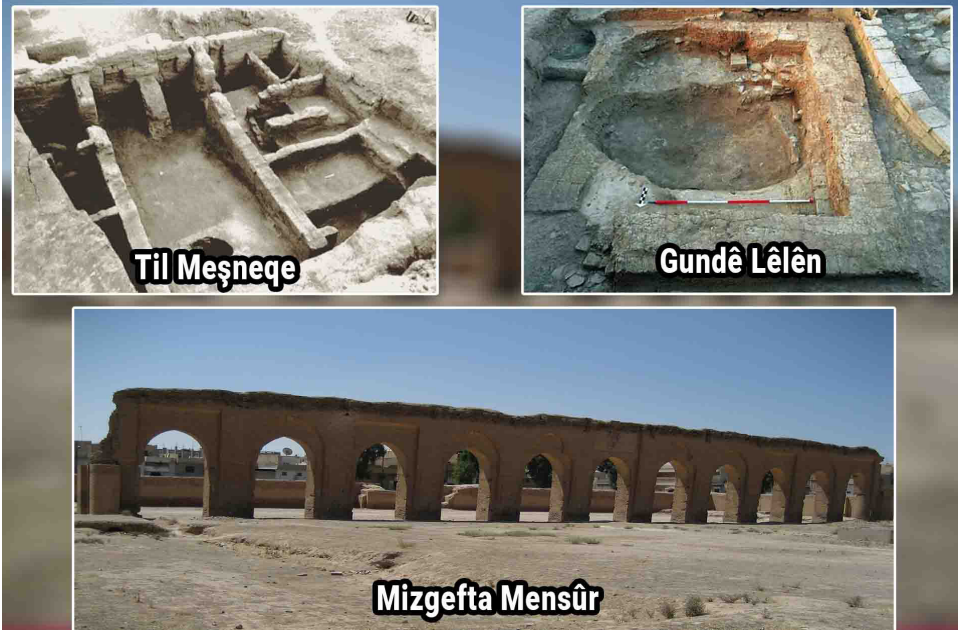
Til Meşneqe | Gundê Lêlên | Mizgefta Mensûr

Lêlên ji girîngtîrîna cihên stratejîk ên serdemên kevn e. Her wiha di wê demê de cihêkî bazirganiyê yê girîng bû û tê de depoyên genim hebûn. Şêniyên wê bi pirranî bazirganî dikirin. Heta niha ji şûnwarên depoyên genim lê hene.undê Lêlên bi 8 km dikeve bakurê navçeya Tirbespiyê. Gund bi girê xwe yê dîrokî navdar e. Şûnwarên gir heta niha mane. Derdora 150 sal berê gund li rex girê dîrokî hatiye avakirin. Li gorî lêkolînên dîrokî ku behsa gundê Lêlên dikin, diyar dikin ku di wê demê de bajarek bû û navê wî Şexna bû. Di salên di navbera 2300'an heta 2200'an B.Z. de di bin serweriya Împaratoriya Akadan de bû ku gelek navendên Akadî li herêma Xabûr ava kiribûn. Ji deilên ku hebûna Akadan li wê herêmê îsbat dike, hatine vedîtin. Akadiyan bajarê nîzm bi sîreke parastinê gelek mezîn bi qalînbûna 8 metreyan ava kirin. Di dema Akadiyan de bajar ji aliye çandiniyê û aboriyê ve geş bûbû. Akadiyan gelek avahiyeñ giştî weki perestgeh ava kirin û ayînên baweriyaya Akadiyan lê pêk dianîn. Şandeya Amerîkayê di nîvîsandina raporên xwe de ruqmenî mixî û peykerên axî ku di vekolînan de diyar kiribûn ku girê gundê Lêlên ji girîngtîrîna cihên stratejîk ên serdemên kevn e. Herwiha di wê demê de cihêkî bazirganiyê yê girîng bû û