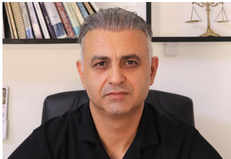
agirbest bê ragihandin.

Êrişa li ser Serêkaniyê li dijî mafê mirovahiyê bû. Ji ber dema tu sînore dewletekê derbas bike bê destûra wê dewletê, ew dewlet jî bêdeg be wê sîncên mezîn jî bêkirin. Di encama wê de êrişa leşkerî ji aliya hezaran ji komên çete yên girêdayî dewleta Tirk û Tirkiyê bi xwe bi balafirên şer, çekên qedexekirî, şerê bejahî û hemû cûreyên çekan hate kirin. Tevî ku li hemberî wê yekê berxwedaneke bêhempa hate kirin jî, lê mixabin hemû cihan di erêkirin û bîdengiya vî şerê de bû. Di encamê de xelkên bajarê Serêkaniyê, Girê Spî û gundewarên wê bi darê zorê ji malên xwe hatin derxistin û bajar hat dagirkirin. Hem jî wê demê hevpeymanekê di navbera dewletê Tirk û Emerîka, Tirk û Rûsya de pêk hat ku tevî bajar çûn jî