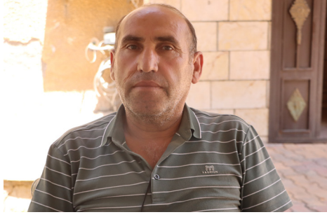
‘Ji bo azadiya gelan heta serkeftinê em ê têbikoşin’

Lê xwebatên wê pirani bi mijarên xizmetguzarî ve dihat mijolkirin, mîna bi na û xaz tenê ve mijûl dibûn. Ji bo wê pirsgrîkên civakê yê ku rû didan, bi hêviya saziyên girêdayî Rêveberîya Xweser wek deste û ofîsên girêdayî encûmena cîbcîkar ku di wir de ew mijar bi wan ve dihatê hiştin. Lê niha em dixwazin îradeya komînê bi van pirsgrîkên civakî re ku gel bi îradeya xwe bibe xwedî hêza çareseriyê, hem gel bi îradeya xwe taxên xwe yan di rêya wê meclîsê re, derxîne holê. Di heman demê de civakeke bi îrade û rêxistinîkirinê ku karbin ji pirsgrîkên civakî yê ku rû didin, bibe bersiv, ava bikin. Ji bo wê jî ji bo ev sistem bi awayekî demokratîk cihê xwe bigire, em li ser biryara xwe bi israrin ku hemû karmend di