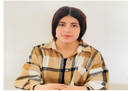
'Xebatên ku îro ciwan dikin, bi saya Rêbertî ye'

heman demê de ev bûye 25 sal in ku Rêber Apo di nav zindana Îmraliyê de berxwedaniyêke mezin dike. Ew bi fikir û felsefeya xwe li dijî hêzên serdest yê ku gelan dikin kole, xebatê dike. Em dizanin ku sedema hilweşandina hemû şoreşên kurdan jî ber siyaseta impratoriyeta Osmanî ya qirêj bû. Di dema niha de jî ji ber peywendiyên dewleta Tirk a faşîst bi hêzên komploger re, Rêbertî da girtin. Sedem ew bû ku Rêber Apo xwediyê pirojeya Neteweya Demokratîk a ku ji bo gelên bindest rîya çareserîya azadiyê bû. Bi saya ramanên Rêber Apo jî gelên bindest hatin hişyarkirin ku êrdî pêwîste civak li dijî serdest û kesên ku dixwazin gel kole bikin, tîkoşînê bikin. "