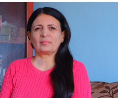
Fêrbûna zimanê kurdî