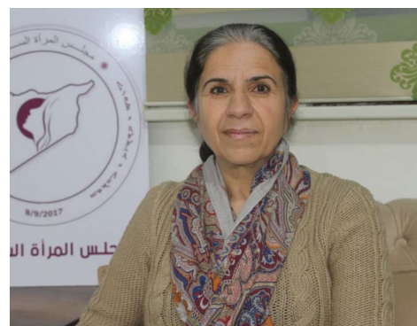
nasnameya wan were eşkere kirin, wekheviya pêkhatayan di hundirê sûrî de jî çêbibe biryarê ev xal di nava xwe de dihawand."

îro guhertin di sistema rêjîma Sûrî de çênebûye, lê belê di nav gelê Sûrî gelek kuştina navxweyî bû, ji ber vê yekê gelek kongir lidarketin da ku biryarek were danin; ji bo vî pîrsgirêka Sûrî, wek; Kongirê Cinêv ya yek, du û kongirê Vîyêna hatin li darxistin û tede hat niqas kirin ku divê çareserî jî vî pîrsgirêkê re were danîn, ji ber ku gelek zirar gihaye gel û bi taybet li ser jinê, 2013'an de hevdiştin di nav 40 dewletan de hat kirin, heta 2015'an jî alûziya di hundirê Sûrî de çareser nebû bû. Di 15'ê Berfanbara sala 2015'an de biryara navneteweyî ya 2254'an derket tede; çareserî jî bo pîrsgirêka gelê Sûrî di aliyê siyasî de were kirin, şerê leşkerî bisekine û kesên koçber bûn jî bikaribin careke din vegeerî bajarê xwe. Her wiha rola rêjîma Sûrî jî jî destpêka alûziyê heya roja îro bi heman deng û siloganan bang dike, heya roja