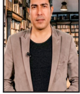
Modêla Civaka Sivîl