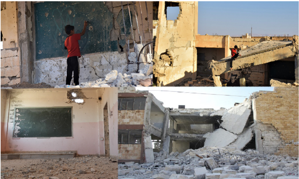
‘Berxwedanî û têkoşina gel mezintir dibe’