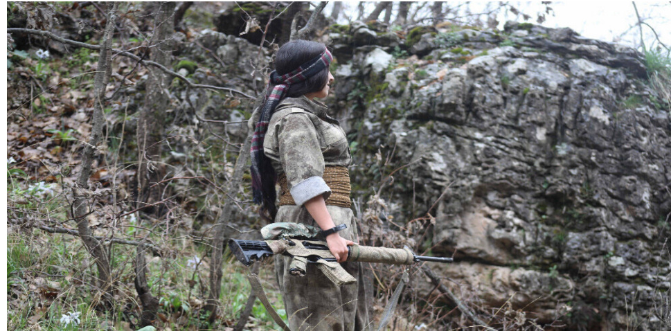
bike û teqez bi ser bikeve.”