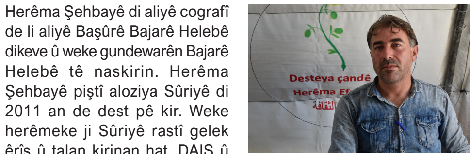
“Dewlet pişaftina çandê pêktîne”

Mihemed di destpêka axaftina xwe de anî ziman ku avakirina dewletan re çanda gelan û pîrbûna çandan ji holê hatin rakirin û hikumeta gelan temsîl dike, li ser wan nîrxanîfî tîn mezinkirin da ku çanda resen a civakê neyê pişaftin. Lê belê bi avakirina sistema dewletan re destdirêjî li vê yekê hat kirin û xwestin her tiştî di bin navê yek netewê de bidin nîşandin. Sistema dewletan li tavahî cîhanê pîrbûna rengan ji ziman, çand, pêkhatê û nasname ji holê rakirin, bi demê re pîraniya çandan hatin helandin û li gor berjewendiyên xwe civak mezin kirin. Dewleta Sûriyê jî ji wan siyasetan ne dîr e, bi avakirina dewleta Sûriyê re hemû çandên ku di Sûriyê de dihatin jîyan kirin