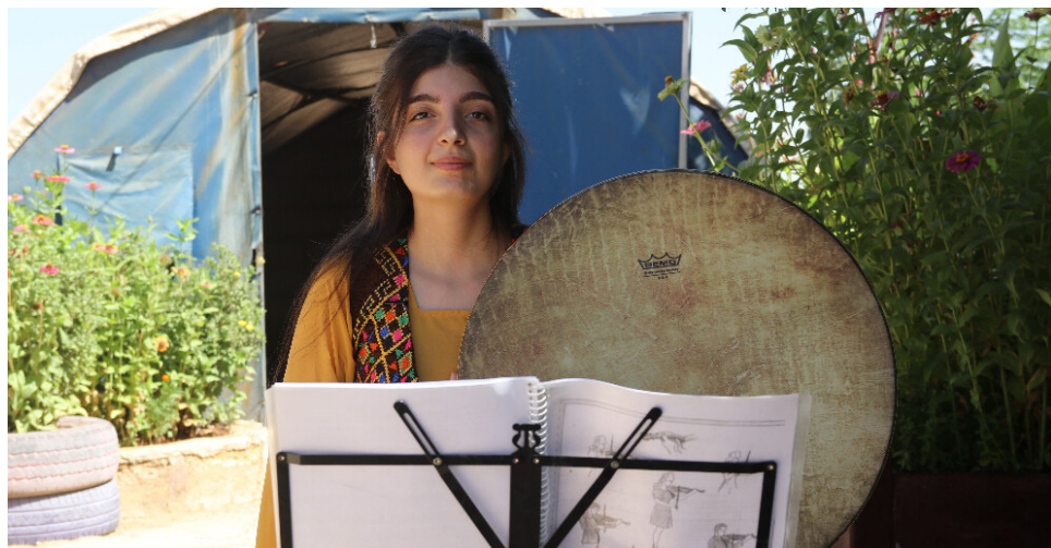
'Min zincîrên koçberiyê qetandin!'

Baryana Sîdo ku li kampa Serdem a Şehbayê dimîne, li gor şert û mercên koçberî û zehmetiyên herêmê li pey xeyalên xwe yê muzikjeniyê dibize.