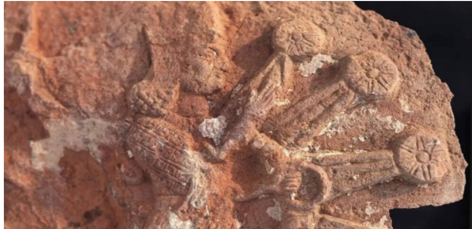
Li bajarê kevnar ê Asûrî Nemrûd yê li Iraqê, peykerekî Starê (Îştar) hat dîtin.

Li bajarê kevnar ê Asûrî Nemrûd ê li Iraqê, kevirê monoment yê mezînan ku peykerê Star (Îştar) li ser hatiye verotin, ji binê erdê hat derxistin. Ev monoment bi hevkarîya Arkeologên Zanîngeha Muzeya Arkeolojî û Antropolojîyê ya Pennsylvaniaiyê û tîma arkeologan a Iraqî ve hatiye dîtiye. Di dema êrişên çeteyên DAİŞ'ê de bajarê