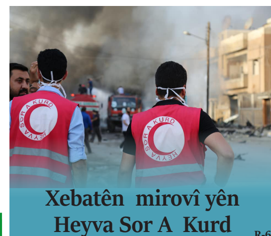
Xebatên mirovî yên Heyva Sor A Kurd