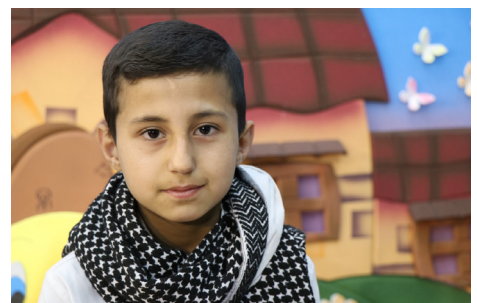
û li tu peymangehên muzîkê perwerde nedîtîye, lê di stranbêjiyê