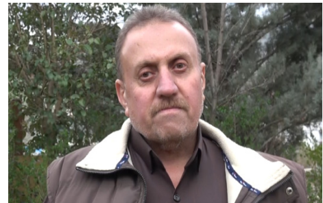
Her wiha Hogir Ehmed ku yek ji

Cotyarên sinorê Balekayeti destnîşankirin ku tevî ku ew li ser hikûmeta Herêmê ne lê bi ti awayî hikûmet guh nade kerta çandiniyê û wiha gotin: "Îsal ji ber di werza biharê de hatina berf û sermayê li herêmê, ziyaneke mezin gihand baxçeyên cotyaran û hemû şitlên ku pişk dabûn hişkûn û serma birin."