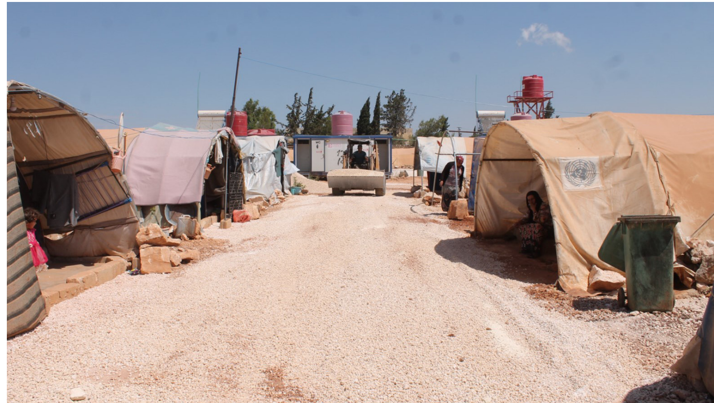
“Bi ambargoya aborî dixwazin herêmê bidin valakirin”