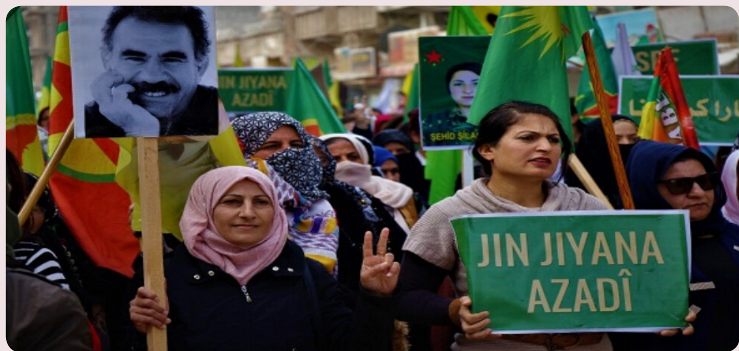
tên kuştin ev jî wek suc nayê dîtin`