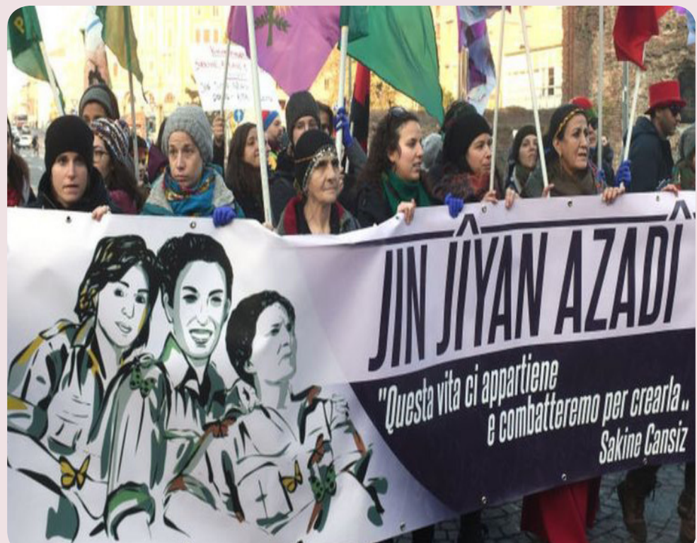
`Naxwazin jin bibe xwedî hêz`

Stêr destnîşan kir ku tevî ewqas îşkenceya li ser jinên Îranê tê kirin,