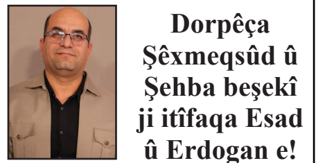
Dorpêça Şêxmeqsûd û Şehba beşekî ji itîfaqa Esad û Erdogan e!

Fermandarê Biryargeha Navenda Parastina Gel (NPG) Mûrat Karayilan da xuyakirin ku dijmin di nava tirsê de ye û got, Divê hevrêyên me jî bizanibin ka rolek çawa dilîzin. Îro çavê her kesî li wan e, bi taybetî jî gelê me. Ji ber wê yekê, divê hevrê jî li ser wê yekê bisekinin ku berxwedanê çawa bi serketinê tacîdar bikin. Em bawer in ku hevrêyên me yê ku ev 9 meh in li hemberî dijmin xwedî ezmûn in, wê dawîya dijmin jî bînin. Dijmin bi lez û bez e, di nava tirs û panîkê de ye, ji ber ku dizanin ku eger hewa biguhere, wê nikarin xwe li dora çeperên berxwedanê bigirin. Ger derfet bê bidestxistin, timênd qadê dikarin zêdetir rola xwe bilîzin. Pêvajoya têkbirina dijmin dest pê kiriyê, divê em wê pêvajoyê heta dawiyê bimeşînin û têkbirina dijmin garantî bikin."