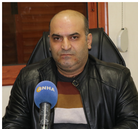
Piroja El-Hewkeme ya taybet bi saziyan

Hesen destnîşan kir ku di sala 2023'yan de wê li ser pêkanîna yên xizmetê û rewşên awarte jî hebe. Kompanyayên taybet û sazî dikarin reqemên ji 4 reqeman bi kar binin, ji bo pêşêkirina xizmetên rêveberiyê (hikumetê) kar bikin, anga wê têkiliyên di navbera saziyên Rêveberiya Xweser, sazî û şaxê wê de de bi awayekî elektronîk bi pêş bikeve û karê di nava xwe de bê meşandin." ANHA