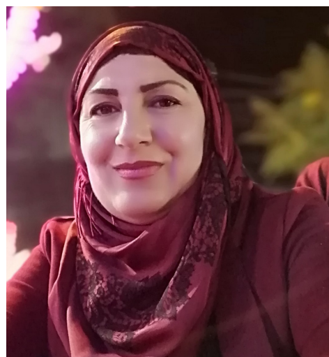
xwe berdewam bikin."