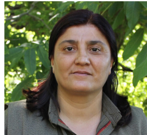
ye. Hezkirina Rêber Apo mirovan azad dike. Dibe ku hinek di vî mijarê de me rexne dikin, lê belê heqîqet ev e. Felsefeya Rêber Apo ji bo tevahiya mirovahiyê ye." - ANF