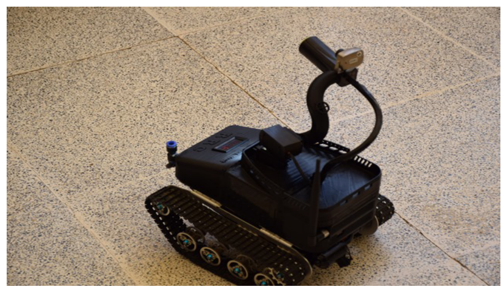
ca sereke ji vê projeyê ew e ku civak sûdê jê werbigirin û xizmeta wan bike, nexasim di

Zanîngeha Rojava kir, lewma di peydakirina madeyên çêkirina parçeyên elektronîk de zehmetiyên dikişîne û got: “Di heman demê de nikare xwe bigihîne zanîngehê navneteweyî, lê tevî vê serkeftina projeya xwe îsbat kir ku li ser asta Rojhilata Navîn