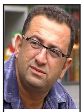
2 Hêzên Kurdan: Gerîla û Şervan