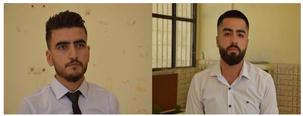
yekane model e.”