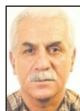
Fermana 74'an ya Şingalê