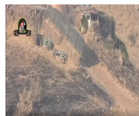
Kurdiştanê dê bibin hedefa me. Wê axa Kurdiştanê ya pîroz ji dagirkeran re bibe goristan.”

Yekîneya Tolhildanê ya Şehîd Bedran Gundikremo li ser çalakiyê wiha ragihand: “Dewleta tirkî ya dagîrker û xayînên ku xizmeta wan dikin divê bizanin ku li her bihosta