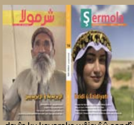
dayîn ku kovareke wêjeyî û çandî li bakurê Sûriyê bi zimanên erebî û kurdî bi navê Şermola were derxistin. ANHA

Di civîna damezrîner a kovarê de ku di 24'ê Îlona 2018'an de li Qamişloyê hate avakirin, tê de gelek rewşenbîrên bakurê Sûriyê amade bûn. Tê de biryar hate