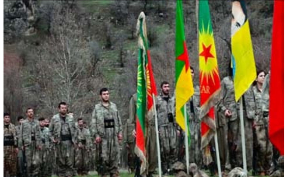
yên li Metînayê, wê tenê li Metînayê nemîne û wê bê wateya destpêkirina şerêkî giştî. Ji ber vê yekê em bang li hêzên siyasî yê xwedî berpirsariyê, rewşenbîr, hunermend û saziyên welatparêz ên Başûrê Kurdistanê, bang li hêzên Kurdistanî hemûyan rabin û pêşî li êrişeke bi vî rengî bigirin.

Ev rewş wê were wê wateyê ku PDK piştgiyariya heta niha dide dewleta Tirk bigihîne asteke bilind. Ev jî tê wateya bicihanîna plana dewleta Tirk ku ji berê ve dixwaze û hewl dide şer bike şerê nava Kurdistan. Divê were zanîn; tevlibûna PDK`ê ya bi vî rengî ya li nava şer, yanî êrişa li ser hêzên me