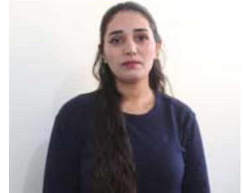
Ji me re axivî û nêrîna xwe ji me re anî ziman.