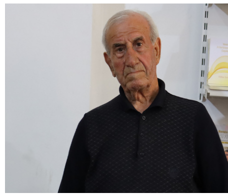
Pêşangeha zimanê kurdî gaveke pîroz e

Di salvegê Roja Zimanê Kurdî (15'ê Gulanê) de Desteya Çandê ya Herêma Cizîrê Pêşangeha Yekê ya Pirtûkên Kurdî ya bi navê (Bi Kurdî Bixwîn, Bişafînê Hilweşînin), li Navenda Mihemed Şêxo ya bajarê Qamişlo vekir. Di pêşangehê de zêdetir 10 hezar pirtûk û bi her pînc zaravayên kurdî hatin pêşkêşkirin, herwiha 15 weşanxaneyên li Rojava, Dîwana Wêjeyê, Yekîtîya Rewşenbîrên Herêma Cizîrê, Yekîtîya Nivîskarên Kurd yên Sûriyê, Saziya Zimanê Kurdî beşdarî pêşangehê bûn.