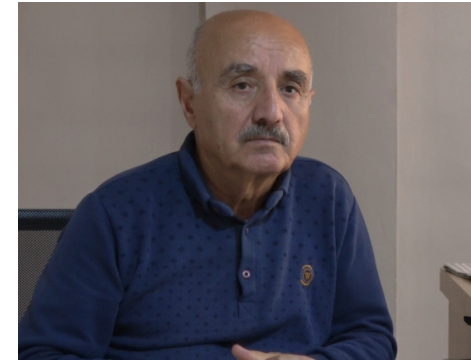
'Bi saya ragihandina kurdî kurdan jî hev fêm kir'

Edîtorê beşa Kurdî ya Rojnameya Ronahî û Nivîskar Diyar Botî, da xuyakirin ku êrişên li ser zimanê Kurdî û polîtîkayên bişafînê pir zêde ne. Lewma asta axaftina bi zimanê Kurdî her ku diçe kêmîtir dibe, bi taybetî îro polîtîkayên bişafînê bi pêşkêta teknolojiyê ketine her malekê; ev yek pir xeter e, îro gelek dayîkên ku dervayî Kurdî di zimanan nizanin, zarokêki ku Kurdî nizanin mezînan dikin û wiha dom kir: "Edî dê û zarok hev û din fêm nakin, ev êşeke pir mezin e. Ji ber vê jî di roja me de rola ragihandinê di pêşxistina zimanê Kurdî de girîngtir dibe. Di parastina zimanê Kurdî de sê lîngên esasi hene; axaftina bi devkî, perwerde û ragihandin."