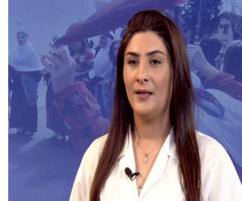
'Axaftina kurdî li ser ekranê li xweşiya me tê'

zimanê Kurdî xebateke berfireh pêk hat; pêşketineke berbiçav hat dîtin, edî her kes bi rêya ragihandinê edat, ziman û çanda Kurdî nas dixe."