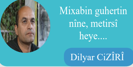
Mixabin guhertin nîne, metirsî heye....