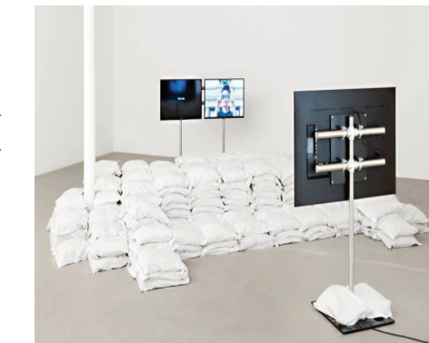
Hunermendên ji disiplinên cuda cuda

Di pêşangeha "Marîpiştîa Şkestî" de wê gelek hunermendên cihê yên bi disiplinên cuda dixebiten werin gel hev û derbarê sansûr, huner û rojnamevaniyê de bi berhemên xwe niqaşan pêş bixin. Niştîman dibêje, di pêşangehê de, li Tirkiyê rewşa hunerê çî ye jî wê were niqaşkirin. Hunermendên Tirk û Kurd yên ku li Swîsreyê dijîn wê xebatên xwe nişan bikin. Li gel wan hunermendan hunermendên Swîsreyî yên navneteweyî jî dê beşdarî pêşangehê bibin û rastiyên tînan ziman li gel xebatên hunermendên din werin pêşkeşkirin."