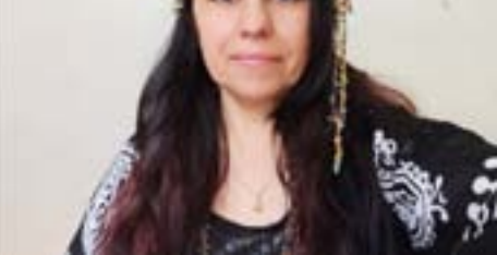
Kongereya Star ya Kantona