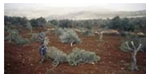
Li gorî agahiyên çavkaniyan ji kantona Efrîna dagîrkirî dayîn, çeteyan li derdora 280 darên zeytûn û gozan birîne û milken welatiyên resen difiroşin.

Çavkaniyan diyar kir ku çeteyên dewleta tirkî ya dagîrker 12'yê Tebaxê li gundên Çoqê û Stêr yê navenda bajarê Efrînê li derdora 130 darên zeytûnan yê welatiyan birîne.