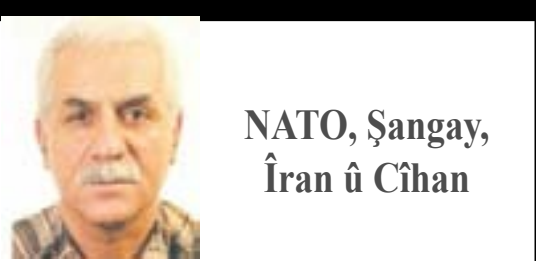
NATO, Şangay, Îran û Cihan

Ev hêza çû Metînayê, bûye sedema wê yekê ku her roj fikarên pevçûnên mezin bigewime hene. Ji ber ku rê birine, heta 300 metreyî nêzî hevalan bûn e. Mesela li wir heywanê hevalan hene, dest danîne ser. Hevalan xwestin van dimena belav bikin, me sekinand. Hinek tişt hene em naxwazin li ser PDK'ê jî bibe mal. Rayedarên wan çi qasî hay jê hene, em pê nizanin. Mesela radibin keran didizin, hespan didizin, dibin ji bo ji xwe re bifiroşin. Ew dixwazin bi şer me têk bibe, me tune bike biçê encamê. Em jî dixwazin bi şer li ber xwe bidin, wî bişikînin û biçin encamê. Berxwedana me ne tenê li Zap û Avaşîn e, berxwedana me jî vir heta Imraliyê ye. Ez dibêjim her tişt li ber çavan e, lazim e di vî demê de her kes li berpirsariya xwe xwedî derkeve. Em ê xwedî li berpirsariya xwe derkevin. Em car din dibêjin em Gelo mirov çi qasî dikare ewqasî hesasiyetê kontrol bike? Ev heqîqetêke. Ji bo wê em dibêjin, banga ku me beriya niha kiriyê derbasdare. Ez hêvî dikim aqûbeta hevalên me di demêke nêz de zelal bibe, em niha li benda wê ne."