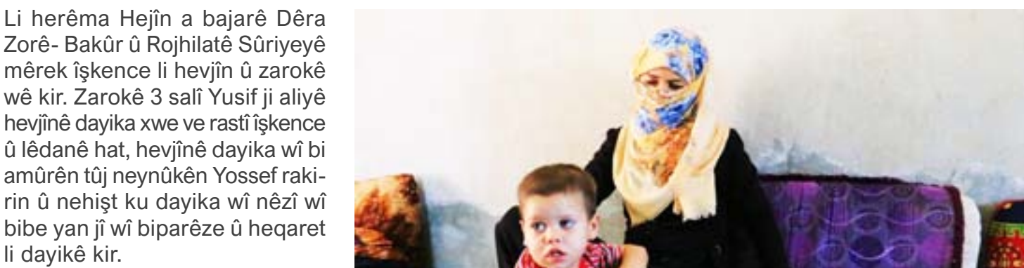
Komîteya Jinan rewşê dişopîne

Bûyereke tundûtûjî û îşkenceya hovane ya din jî li herêma Hejîn a bajarê Dêra Zorê- Bakûr û Rojhilatê Sûriyeyê çêbû. Jinek ji aliye hevjinê xwe ve bi zarokê xwe re bi şîdetê re rûbirû ma.