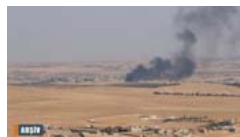
çekan li herêmê ketine. 273 caran gundên sivîlan bi 115 topên bûne hedef. Ev rewş li gel bêdengiya navneteweyî dewam dike. Herwiha 30 sivîlan û di nav de jin û zarok jiyana xwe ji dest daye û 67 kesên din birîndar bûne. Hinek ji wan astengdar bûne hinek jî bi pirsqirên derûnî re rûbirû dimînin. Herwiha li gorî raporê, dibistanek û mizgeftêk li gundê Um Edesê yê bakurê Minbicê, hatine roxandin." ANHA

lisa Leşkerî ya Minbicê û Hêzên Sûriya Demokratîk (QSD), pîroz kirin. Li gorî bilanço, "Artêşa Tirkan ya dagîrker jî baregehên xwe yê li herêma "bêçek" ya li ser xeta Sacûrê û rojavayê Minbicê, 835 caran êriş pêk anîne. Herwiha balafirên şer 4 êriş, balafirên keşfê jî 3 caran li eni-salan ya êriş û topbarana artêşa Tirkan ya dagîrker û çeteyên wê li dijî gundên rojava û bakurê Minbicê, belav kir. Li gorî agahiyên Navenda Ragihandinê ya Meclisa Leşkerî ya Minbicê dayîn, "Gundên sivîlan rojane rastî topbaranê tên. Bi vî yekê jiyana sivîlan, sewalan dikeve xeterê, malên roxandin û zirar digihe erdê çandiniyê. Li gorî raporê, 2900 topên jî her cureyê