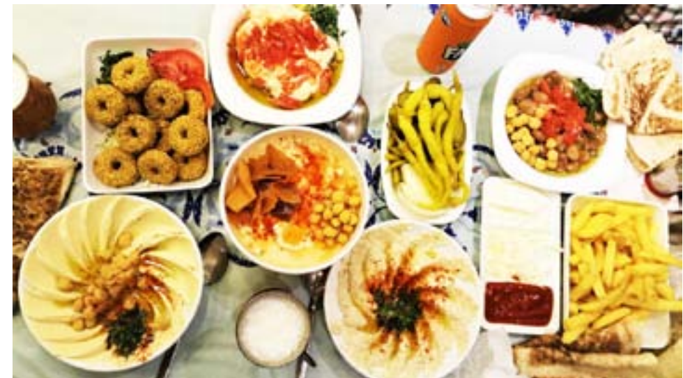
heta êvaran dikelînin. Pişt re em pêdiviyên din yê weke teîn, mast, kemûn, xwê û zeyta zeytûnan amade dikin. Sîr û toza lîmonan jî kesê bixaze em jê re zêde dikin. Bi fûlê re xelkên me himis û felafilê dibin. Çimkî her kes jî van her sê