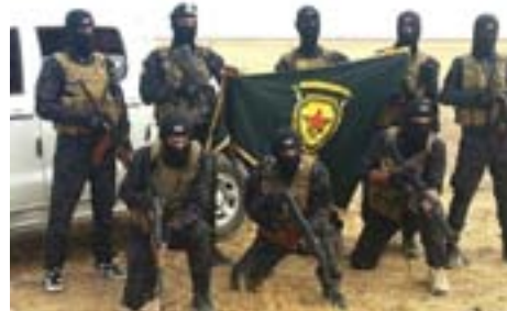
Herwiha gelek madeyên teqemeniyê, çek û belge bi çete re hatin desteserkirin. Navenda Ragihandinê piştrast kir ku Yekîneyên Antî-Terorê yê QSD'ê beşdarî operasyonê bûne û piştgiriya ewleliyê daye hêzên koalisyonê. ANHA

Bi desteka Yekîneyên Antî-Teror yê QSD'ê, hêzên Koalisyona Navneteweyî serçeteyekî DAİŞ'ê girt.