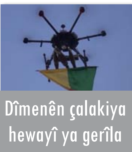
Dîmenên çalakiya hewayî ya gerîla