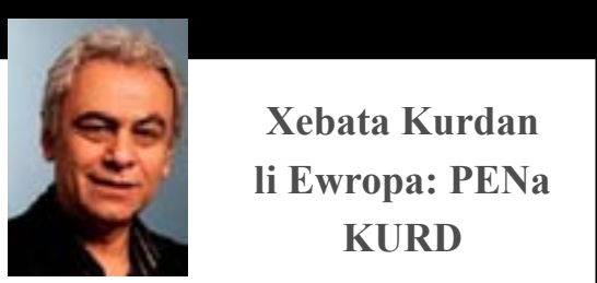
Xebata Kurdan li Ewropa: PENA KURD