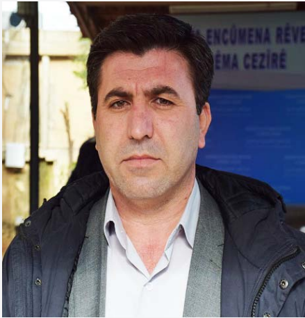
dewleta Tirk hewldana guhartina demografiya herêmên Bakur û Rojhilatê Sûriyê dike,