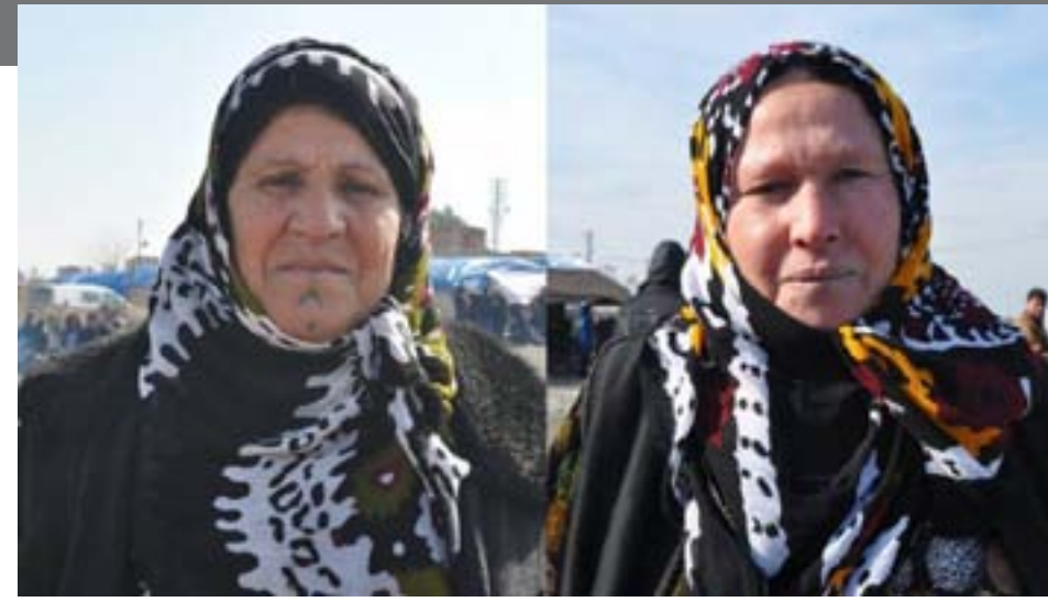
gelê li Rojavayê Kurdistanê heta dawiyê xwe biparêzin û çongê ji dijimin re netewînin. Emê axa xwe