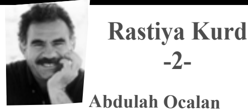
Rastiya Kurd -2- Abdulah Ocalan