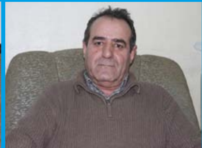
DIVÊ PDK Û YNK GAV BAVÊJIN