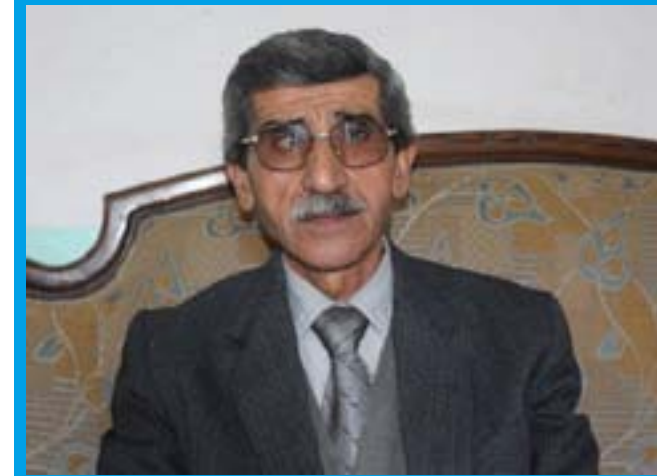
DIVÊ KURD JÎ BIBIN YEK

Gelê Kurd û hêzên siyasî yê Kurd li ser yekîtiya netewî nîqaşên xwe didomînin. Nûnerên partiyên siyasî yê Kurd diyar dikin ku tenê Kurd bi avakirina yekîtiya xwe wê karibe bibe xwedî hêz. Bervajî wê wînda bike.