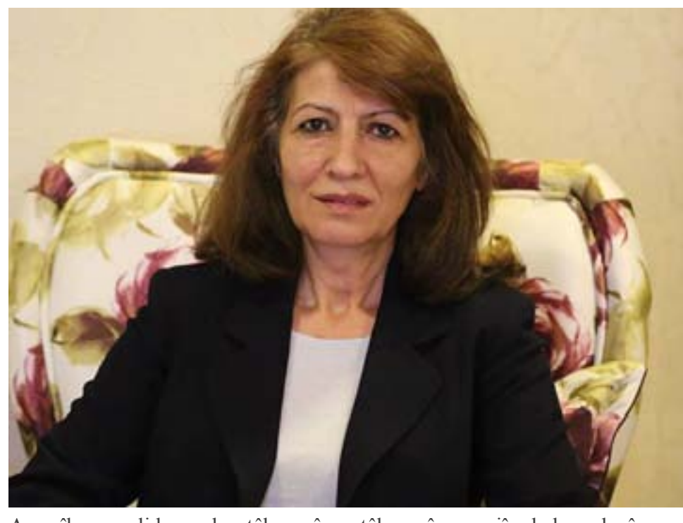
Amerîka pere li beramber têtêkoşerên me pêşkêş dike, tişta ku dikeve ser milê me Kurdan jî, parastina van têtêkoşerên xwe ye. Parastina

li Kobanê dît ku yekîtiya Kurd ya fikrî, siyasî û gîrseyî heşt ku berxwedana Kobanê li cihanê deng vede û YPG di aliye Leşkerî de li dijî hêza herî qirêz DAIŞ'ê serkeftî ne mezin bidest bixe. Eger gelê me bi awayeke lezgin û bi şeweyeke gîrseyî helwest nîşa bîdîn û ev pilana girtina şoreşger û pêşengên Kurdistanê wê jî sernekeve. Wê hemû cihan ji bibîne ku gelê Kurd êdî ne ew Kurdê jî hev belavbûyî û lewaz e." Şanaz Îbrahîm di beşa dawî ya nivîsa xwede jî parastina van pêşengên Kurd weke erkeke exlaqî û mirovî dest digire û nivîsa xwe di van gotinan bi dawî dike, "Eger