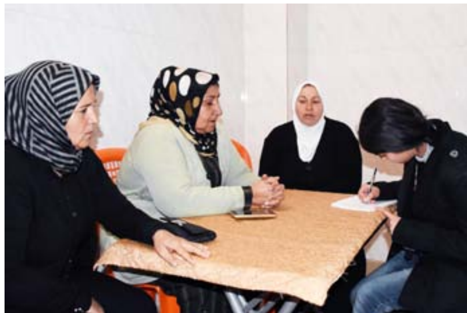
Êzidiyên Efrînê ku ji ber hovîtiya dagirkeran li Şehbayê bi cih bûne bi armanca ku rê û resmên xwe yê olî pêk bînin 3'yê Mijdarê Komeleya Êzidiyên Efrînê ji nû ve li navçeya Til Rifet vekir. Komeleyê civaka Êzîdî di bin

Êzidiyên Efrînê bi mebesta ku rê û resmên xwe yê olî pêk bînin Komeleya Êzidiyan a Efrînê li navçeya Til Rifetê ji nû ve vekir. Jinên Êzîdî diyar kirin wê li hemberî dagirkeran têkoşinê bikin heya Efrînê rizgar bikin. Bi hezaran Êzîdî li Efrînê dijîyan. Bi dehan gundên Êzidiyan li Efrînê hene. Ger wiha li Efrînê gelek pîrozgehên Êzidiyan hene. Êzidiyên Efrînê bi destpêkirina Şoreşa Rojava re bi awayekî azad rê û resmên xwe pêk dianîn. Bi destpêka êrîşên artêşa Tirk a dagirker û çeteyên wê yên li dijî Efrînê, di nav de gundên Êzidiyan bi awayekî hovane hatin hedefgirtin, her wiha pîrozgehên wan hatin talankirin û xirabkirina. Di heman demê de bi sedan Êzîdî hatin revandin û çarenûsa gelek nanayê zanin.