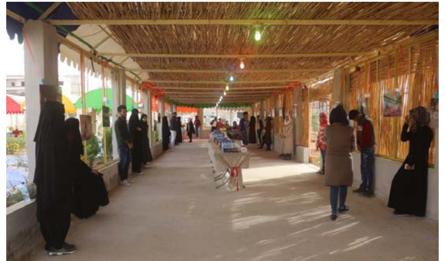
Li gorî berpîrsên komeleyê zarokên ji malbatên feqîr ku komele destekê dide wan, cihê xwe di wê pêşengehê de girtine. Destpêkê zarokên ku wênekêşiyê hez dikin, 35 zarok hatin hilbijartin û dewrole destekê dide wan, cihê xwe di wê pêşengehê de girtine. Destpêkê Zarokên ku tevli pêşengehê bûne jî hejmara wan 30 zarok e û wêneyên ku di pêşengehê de hatin pêşandan hemû jî bajarê Minbicê ne... ANHA

Komeleya Ronahiya Pêşerojê ya Xêrxwaziyê bi dirûşmeya "Ez li vir im" li bajarê Minbicê pêşengehek vekir. Pêşengeh li Kafeterya Erd El-Seide ya rojavayê çerxerîya Sebi Behrat a bajarê Minbicê hate vekirin. Bi dehan welatîyên Minbicê û malbatên zarokên ku tevli pêşengehê bûne, endamên sazî û komîteyên Rêveberiya Sivil a Demokratîk a Minbicê û Gundewarên wê, di vekirina pêşengehê de amade bûn.